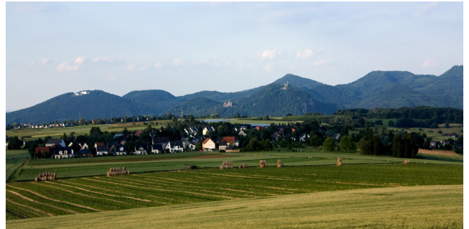
Gimmersdorf und das Siebengebirge